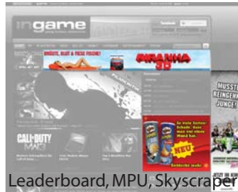
Leaderboard, MPU, Skyscraper